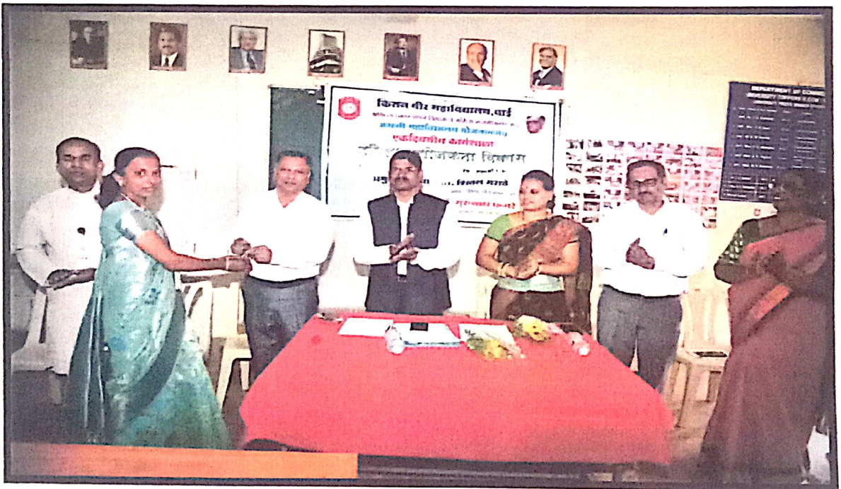
Welcoming of All Honourable Guests